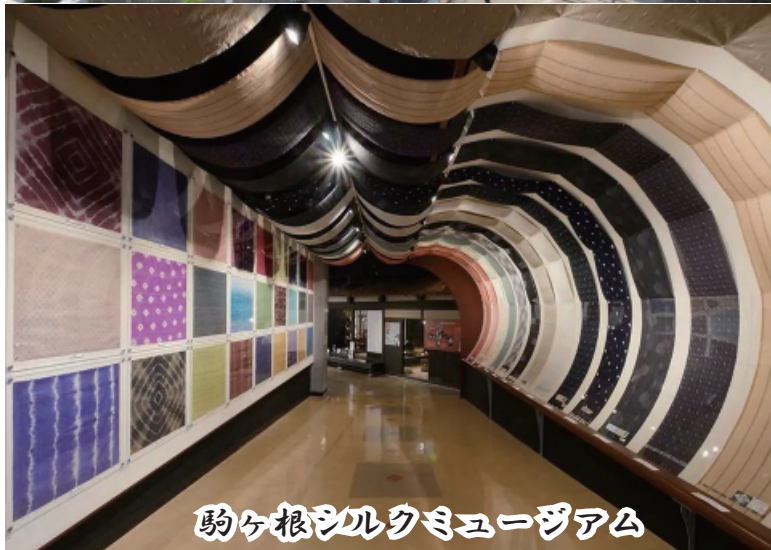
駒ヶ根シルクミュージアム